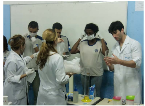
Ao manipularem os alimentos para a confecção do iogurte, os alunos formaram conceitos de higiene e segurança alimentar