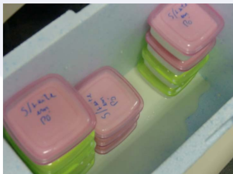
Uma câmara em isopor, com termostato e luz interna, foi feita pelos alunos do PPGCAL para obter os 45°C na fabricação do iogurte

Calculada inicialmente na solicitação da FAPERJ para com o edital “Cientistas de nosso Estado”, que estabelece uma atividade docente em sala, a aula prática sobre fermentação láctica – ou como preparar o iogurte – ministrada por um grupo de dez alunos do Programa de Pós-Graduação em Ciência de Alimentos/IQ, em 22/9, no Colégio Estadual Bahia, foi um sucesso. Não só para os alunos do Colégio que a assistiram, mas também para os pós-graduandos que a